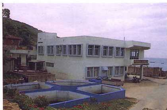
連江縣水產試驗所

由於馬祖屬於戰區，實施燈火管制，許多燈火漁業如棒受網等，均無法生根。為促進馬祖地區漁業發展，建議適度開放燈火漁業以捕撈鎖管類；並配合集魚燈之使用，以蝦曳網或表層曳網拖曳蝦皮。