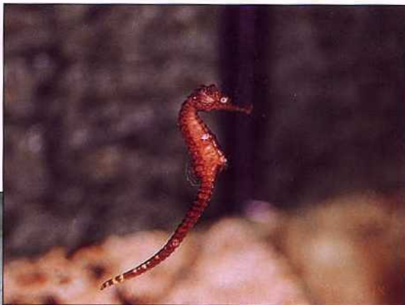
▲甚受遊客喜愛的「海馬」，是魚族中的怪胎