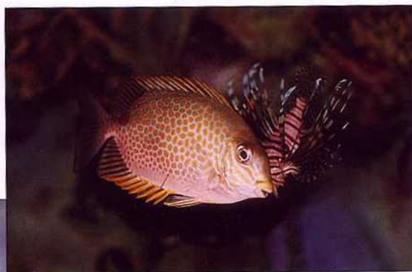
▲澎湖人喜歡吃「臭都魚」，卻給牠一個有點怪異的名子—「羊矮仔」