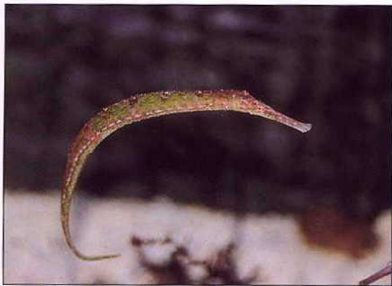
▲可憐的「海龍」是國人滋補養身常用的中藥材