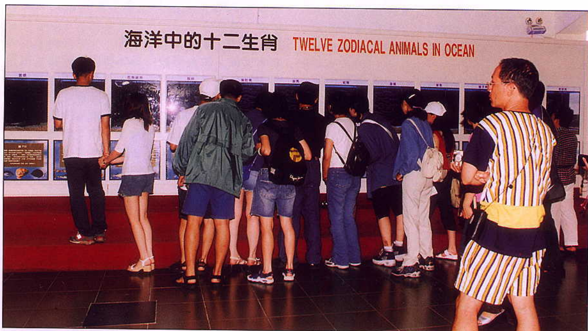
▲「海洋中的十二生肖」展示區

台灣人對十二生肖一直有著難以割捨的宿命情結。每屆龍年，總有非常多的夫妻計畫著搶生「龍子」、「龍女」，而當您對十二生肖如數家珍、倒背如流的同時，您是否知道，在繽紛多彩而又神秘的海洋世界中，也有十二生肖？在澎湖水族館開館週年慶當天，我們推出這項另類又有趣的主題展，希望帶您從另一個角度去認識這群生活在海洋中的驕客。