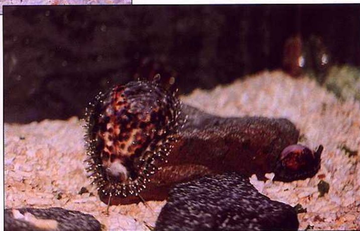
▲澎湖人稱「寶螺」為「豬嬖」，「豬嬖」是笨蛋的意思