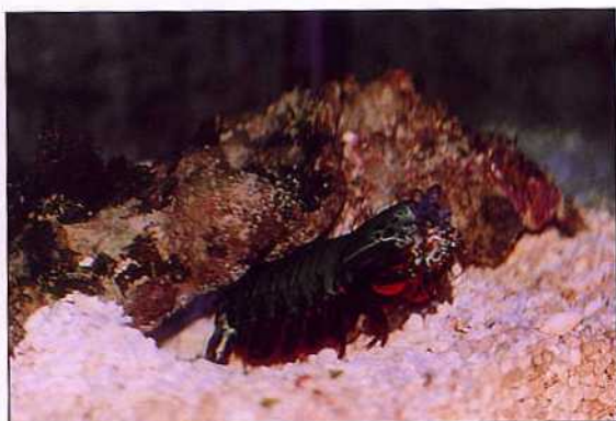
▲「蝦姑」閩南語叫「蝦猴」，是釣大魚極佳的活餌

「猴」為靈長類，其性聰明、頑皮且好動，相信每個人對齊天大聖孫悟空的故事定是耳熟能詳。而沉潛於海中的「猴」是否也一樣具有通天的本領呢？近來漸受小朋友喜愛的「海猴寶寶(豐年蝦)」，其實長得其貌不揚，