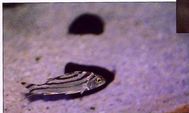
▲「花身雞魚」被釣上後會發出「咕咕」的叫聲

但倒有猴一般好動的個性。而「蝦姑(蝦猴)」那一對像鐮刀又像國劇中美猴王手形的螯腳雖足以打破燒杯，但無論在海中或陸上都是老婆搶手的美食。