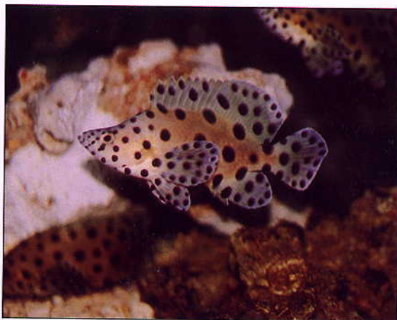
▲價高味美，令人垂涎的「老鼠斑」