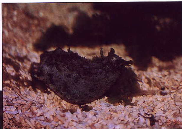
▲「海兔」吃東西時總是細嚼慢嚥