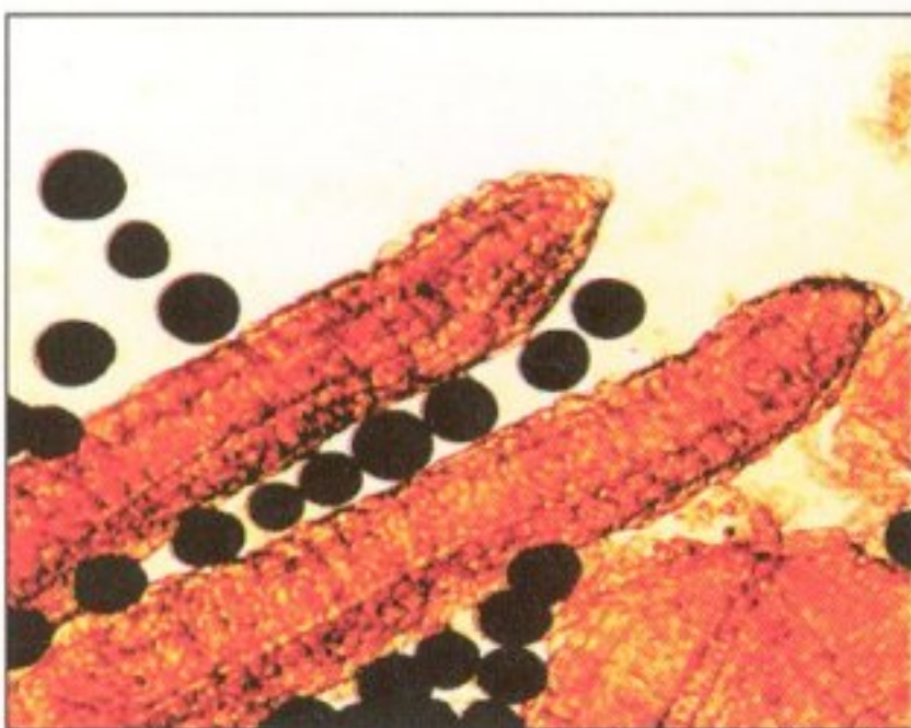
圖1 附著期—吸附於魚之鰓絲上

根據本研究之結果，當池魚受卵圓鞭毛蟲感染時，可先使用福馬林30 ppm或高錳酸鉀2 ppm，清除附著於鰓絲與體表之營養體(trophonts)。4小時後再加入硫酸銅0.5 ppm，以阻止孢囊體的分裂與發育。藥浴24小時後，視水溫高低，隔1或2日，再施用硫酸銅0.5 ppm，殺除浮游幼體，才能達到完全防治的目標。