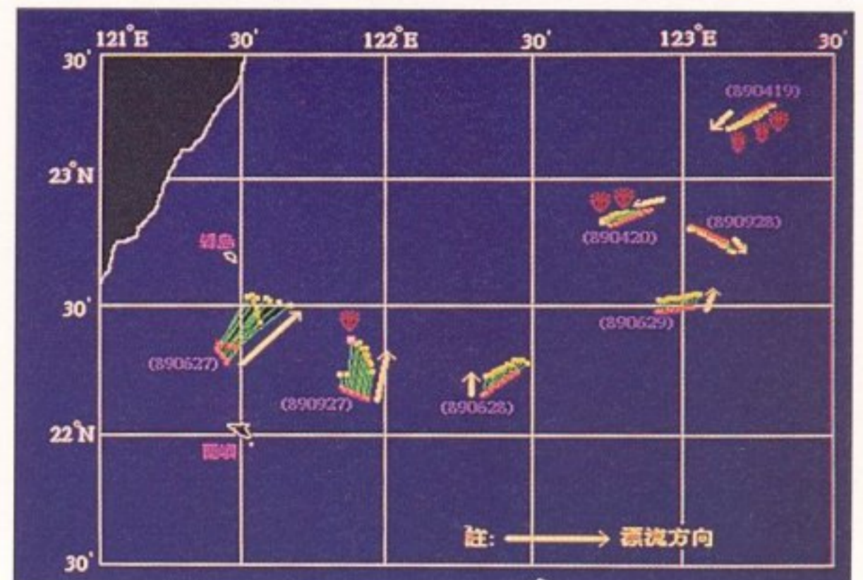
圖 2 漁具投揚繩期間受洋流漂移示意圖