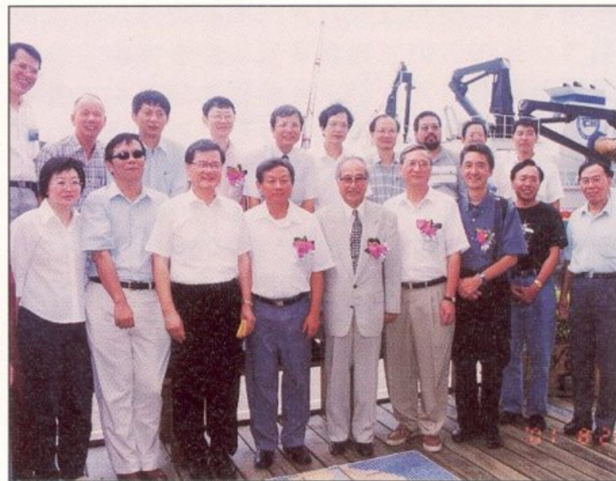
與會人員於簽約儀式結束後在南向大樓旁合影留念