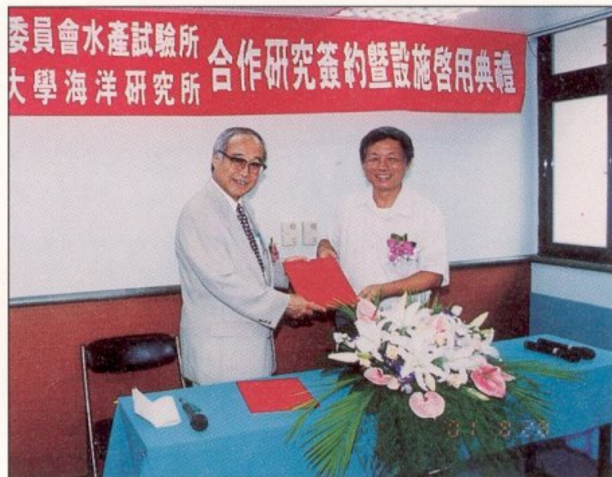
簽約後交換合約書