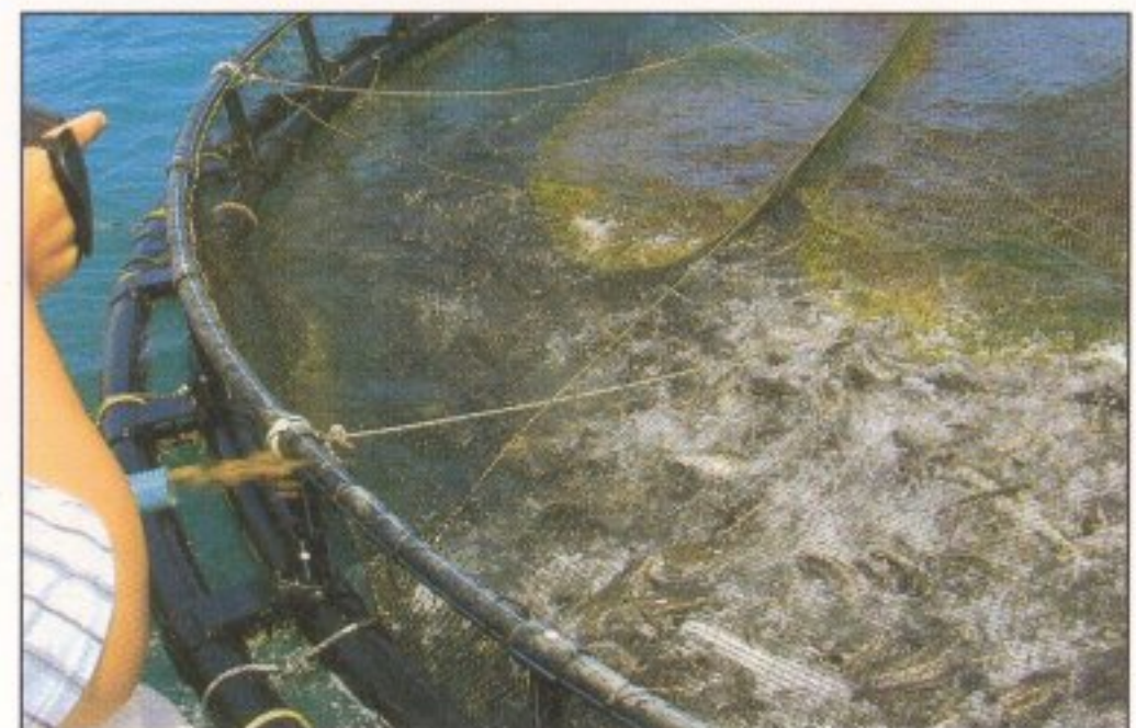
使用噴槍式自動投餌系統投餵海籠狀況