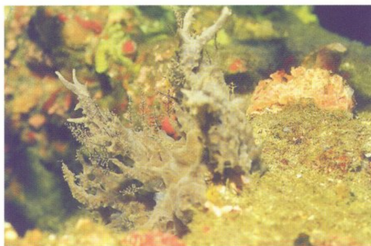
圖 4 七美人工魚礁上之附著生物