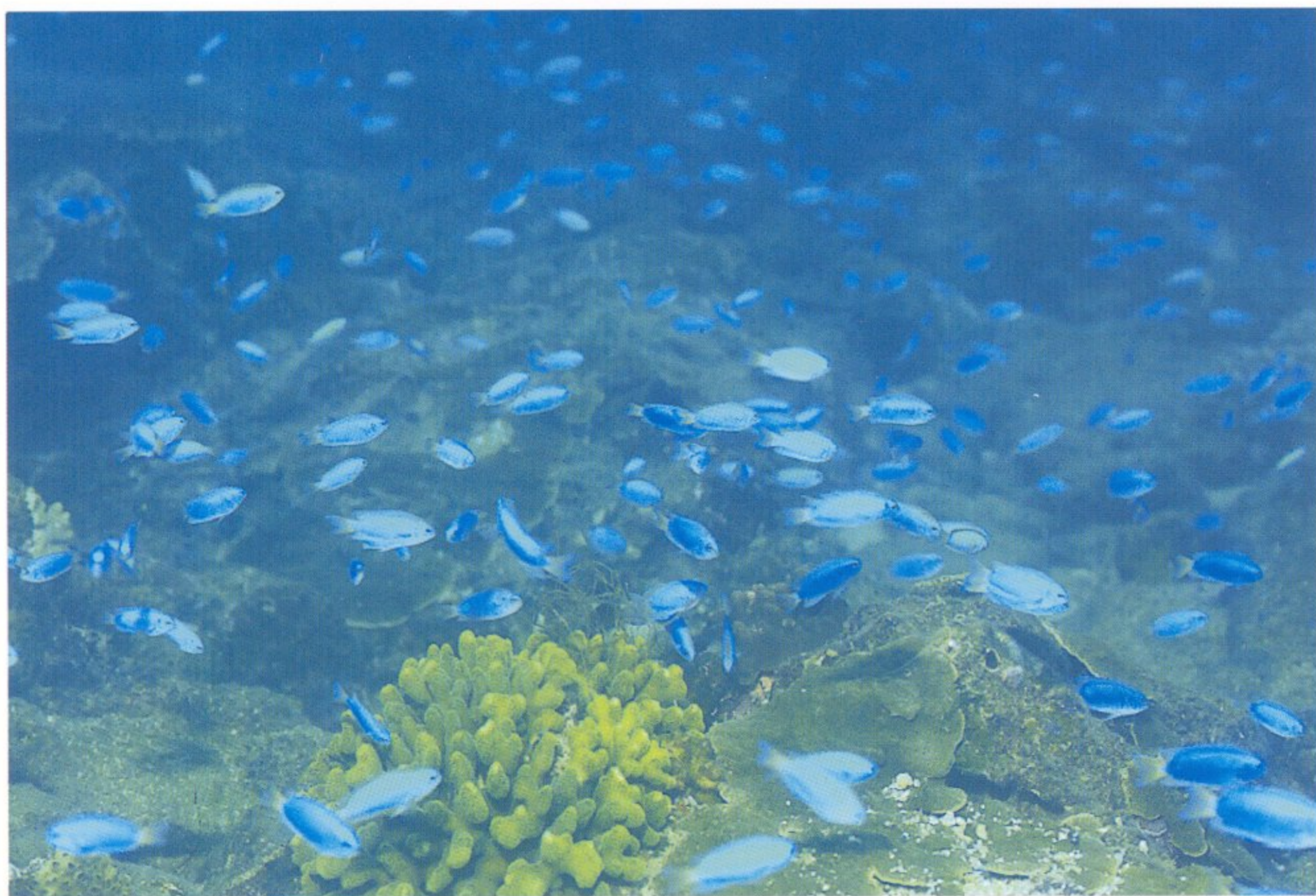
圖 1 七美天然礁魚類—藍雀鯛( Pomacentrus coelestis )

計 21 科 43 種魚類，以縱帶笛鯛、雙帶烏尾冬、三線雞魚、黃尾金梭魚、薄葉單棘魷為主。