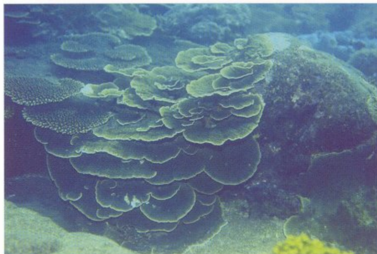
圖 3 七美天然礁

魚類相之相似度以水泥礁與船礁間之 59 % 最高，其次為東崁與燈塔下間之 58 %、月鯉港與燈塔下間之 52 %、船礁與月鯉港間之 18 %。