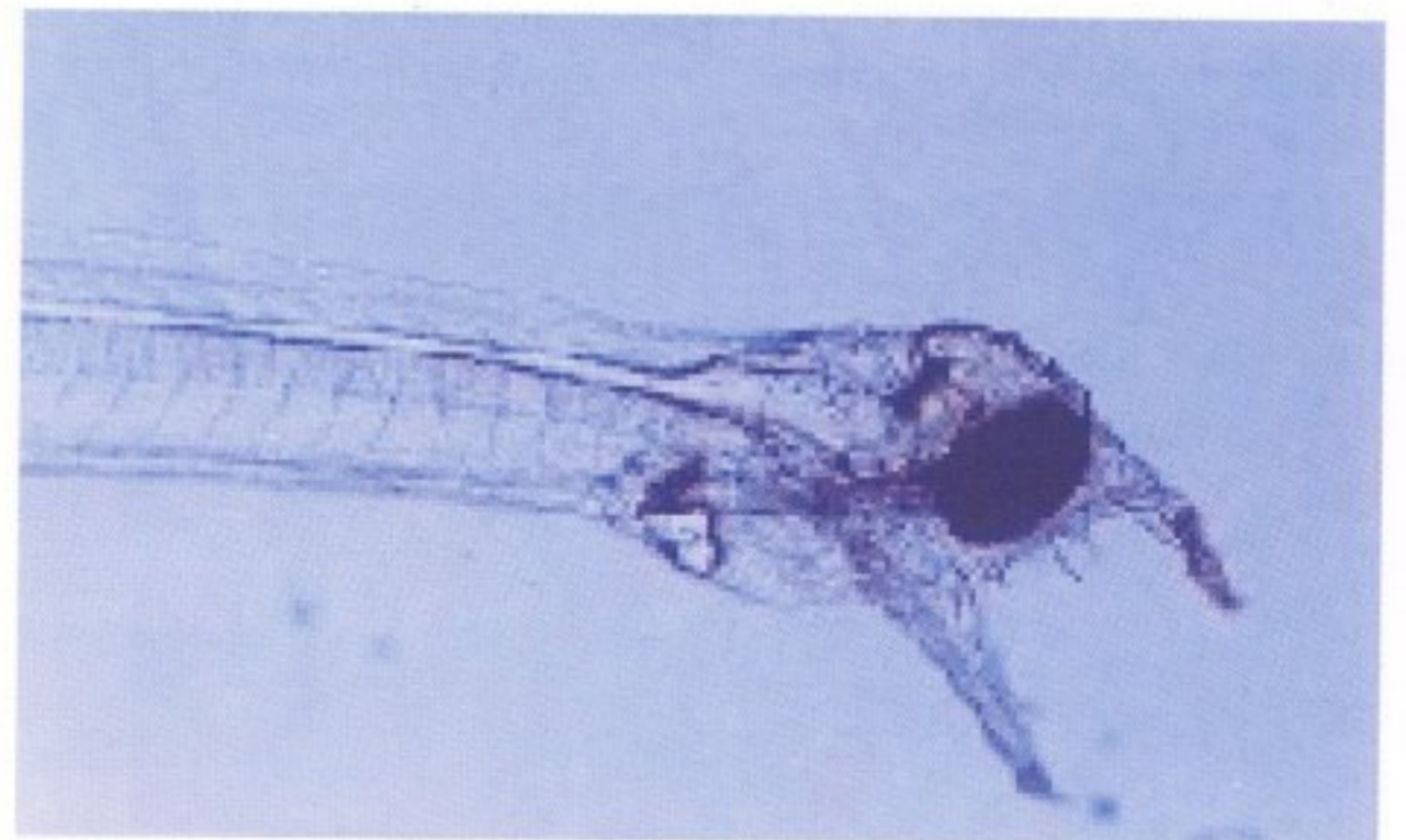
圖 3 孵化後第 7 天之仔鰻，具顎齒之頭部