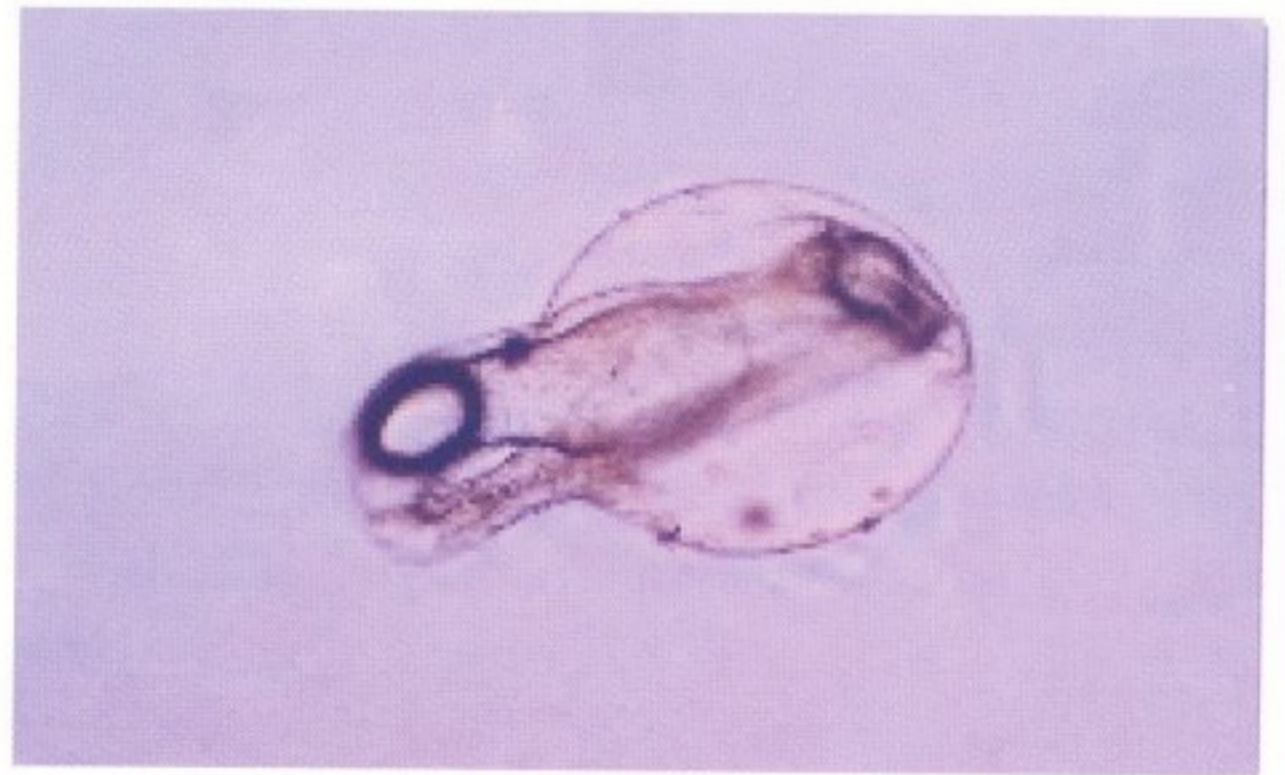
圖 1 即將孵化之仔鰻

HCG 之使用量由初期之每公斤鰻魚體重 500~1000 IU 降為 50 IU，並將催熟間隔由 7 天縮短為 3 天，使催熟所需時間由 70 天降為 45 天，雌性種鰻較不會發生腹脹及卵巢外露現象，體力尚佳，誘導自然產卵之機會就顯著提高。