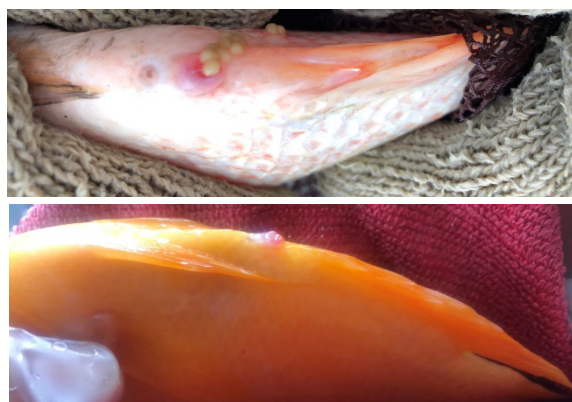
圖 1 吳郭魚(上)及紅魔鬼種魚(下)人工催熟試驗

在紅魔鬼試驗中至 18 小時仍無任何產卵跡象。接續每 4 小時抽驗 1 次，在紅魔鬼種魚均無採到卵，一直到注射 48 小時犧牲單尾高劑量雌魚，經解剖確認在腹中有少量卵粒，但並未成熟到足以人工擠卵排出。而部分注射激素的雄魚輕壓腹部可以採得少許精液，激素的組成與施用劑量仍有待探討。比較試驗成果後初步判斷紅色吳郭魚之生殖發育較成熟，然而紅魔鬼等觀賞用慈鯛體型較小，其魚隻的生殖