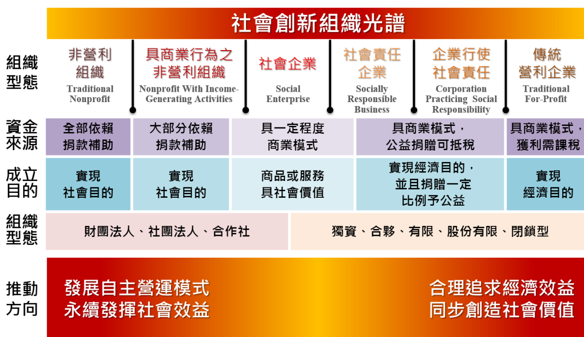
圖 2 社會創新組織光譜

為進一步促成經濟、社會、環境等包容成長，政府單位應充分發揮其角色與功能推動社會創新精神，藉與民間共同合作及科技創新應用，重新定義並翻轉往昔制度、營運模式及組織結構，從不同地區、領域、組織型態孕育各類社會創新模式，於相應議題中找出具體解決方案，逐步朝向文化臺灣、綠能矽島、智慧國家、公義社會、幸福家園發展。