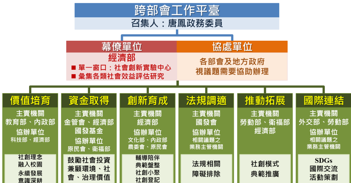
圖 4 社會創新行動方案架構

由於社會創新發展之組織型態涵蓋公司企業、合作事業、非營利組織或者校園團體等。本行動方案由相關部會共同催生各種樣態之社會創新典範模式，積極推動倡議廣宣、資金籌措、資源連結、法規鬆綁、機制試行及國際交流等措施，為我國社會創新提供相應支援。其推動策略如下（工作項目、經費匡列及期程請參閱附件）：