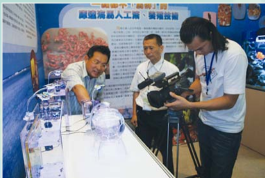
電視媒體採訪鬻的人工孵化過程