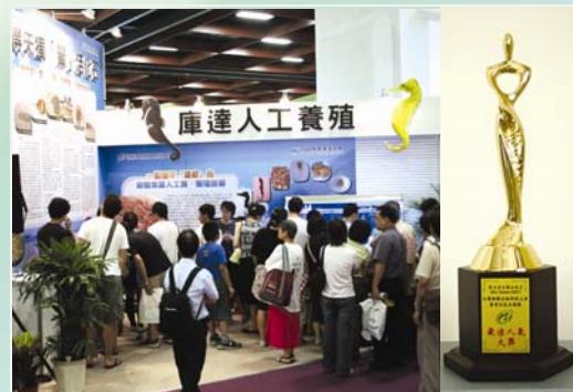
「海馬及鬻」櫥窗獲頒最佳人氣獎