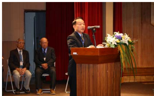
李副主委健全於開幕典禮上致詞，代表農委會歡迎全體與會者