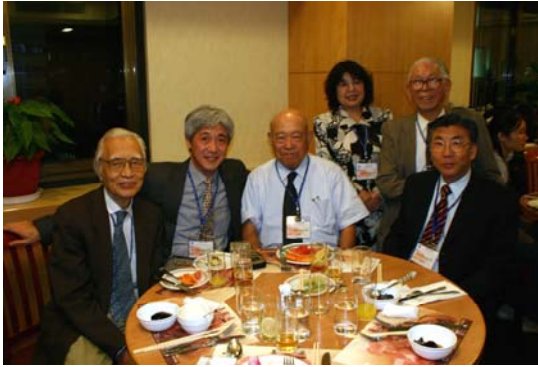
蘇所長參加閉幕晚宴，向與會貴賓致意