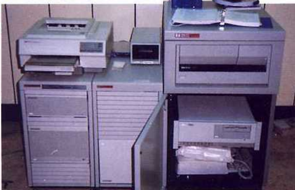
3. Vectra, HP9000/825 電腦系統, 8mm 磁帶機, 1/2吋 1600/6250 BPI 磁帶機及雷射印表機