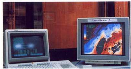
4. 終端機及彩色監視器