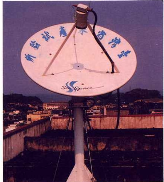
1. 直徑 1.2m 天線架設於本所頂樓，接收 NOAA-IRPT 資料

本系統之建立係由行政院農業委員會分年補助而成，期能提供國內欠缺的連續性廣域海況資料以為漁海況研習用。今後將朝向中文化、自動化的作業方式，以便提供更有有效的服務。