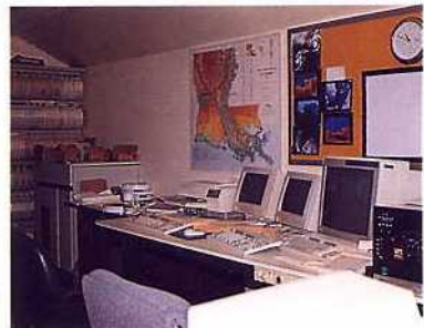
美國路易士安那州立大學地理系之衛星遙測中心，其基本設備與本所目前之系統相同，但週邊設備較為完備