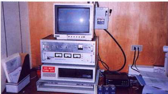
2. PC/XT 負責軌道之計算、控制天線追蹤衛星