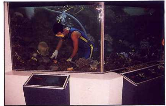
新加坡海底世界 — 水池清洗