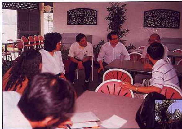
新加坡海底世界 — 在餐廳內座談