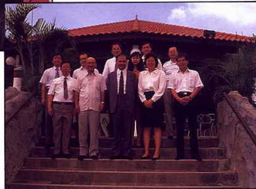
新加坡海底世界 — 考察團合影