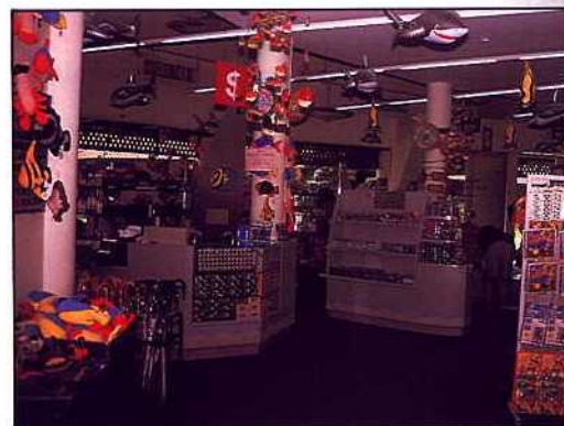
新加坡海底世界 — 藝品店