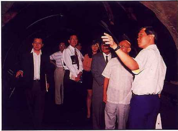
新加坡海底世界 — 海底隧道內