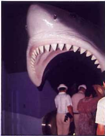
香港海洋公園 — 鯊魚館入口