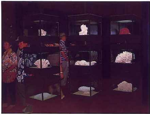
香港海洋公園 — 海洋館內珊瑚區