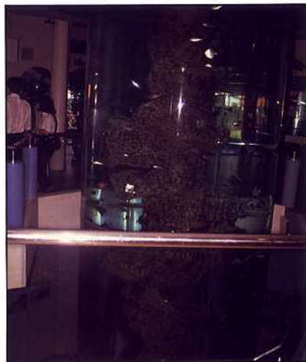
新加坡海底世界 — 垂直透明水槽