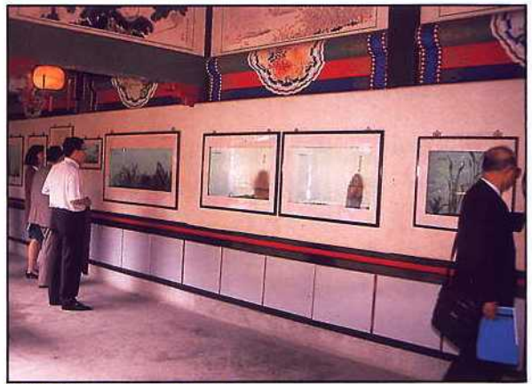
香港海洋公園 — 金魚大觀園