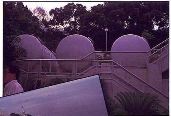
香港海洋公園 — 過濾維生系統