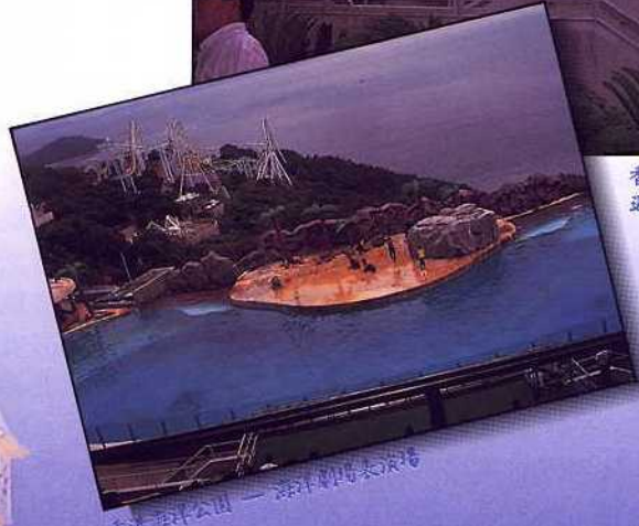
香港海洋公園 — 海洋劇場表演場