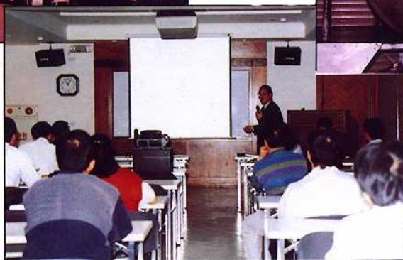
蜆精、蜆精粉產品發表會現場