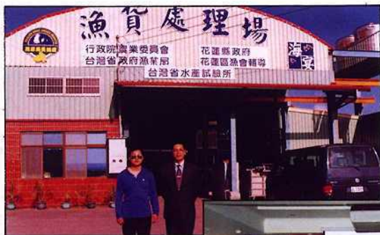
蜆原料及加工處理場

由於該蜆精產品的研發成功，是目前國內產、官、學界合作開發的成功範例，其合作模式可供做其他農漁業產業昇級的參考。本系亦將陸續對相關水產品進行機能性成分研究，以供水產業提昇競爭力並拓展市場空間。