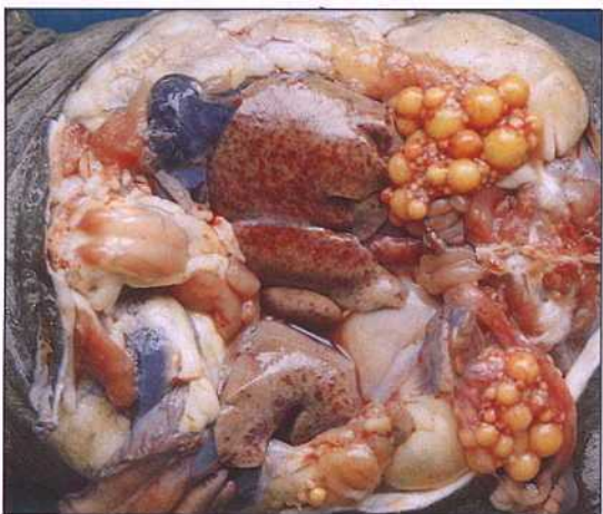
親水性產氣單胞桿菌病