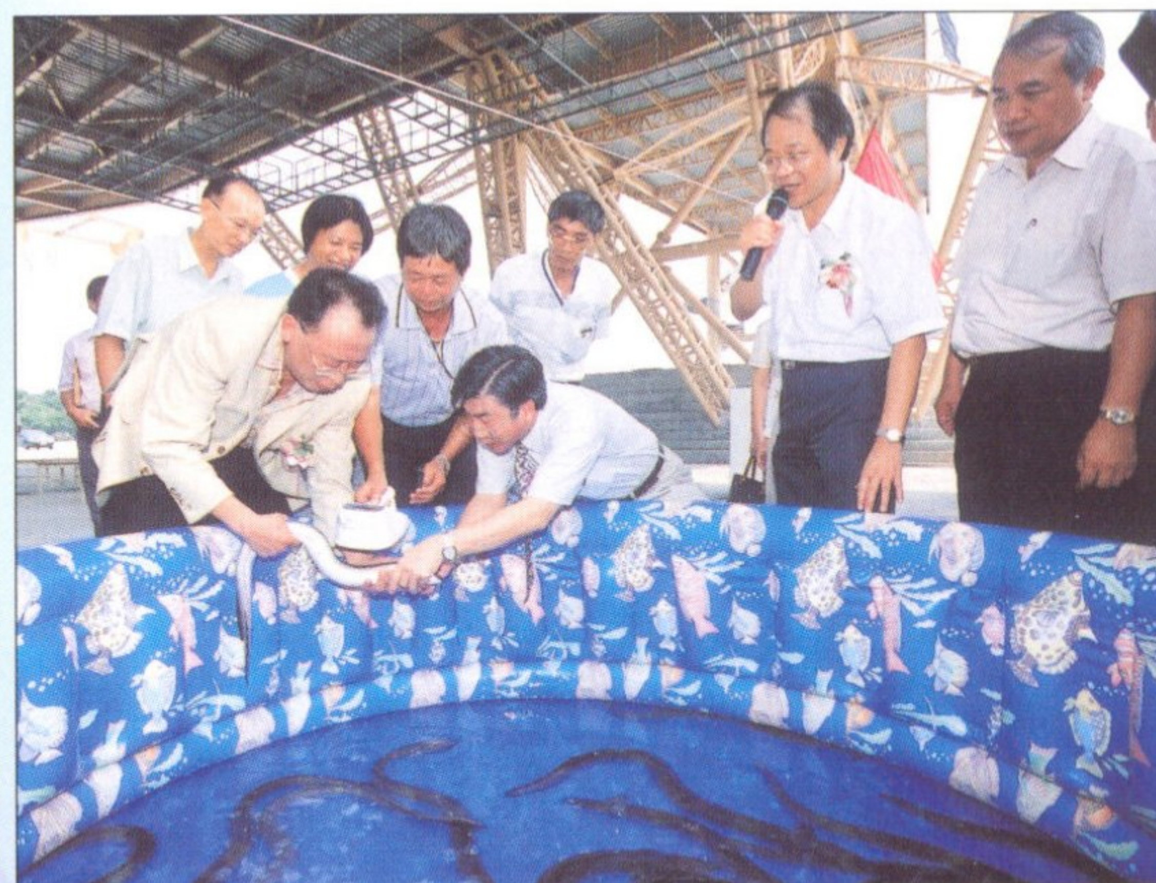
圖2 展示已植入晶片標識之大型放流鰻魚