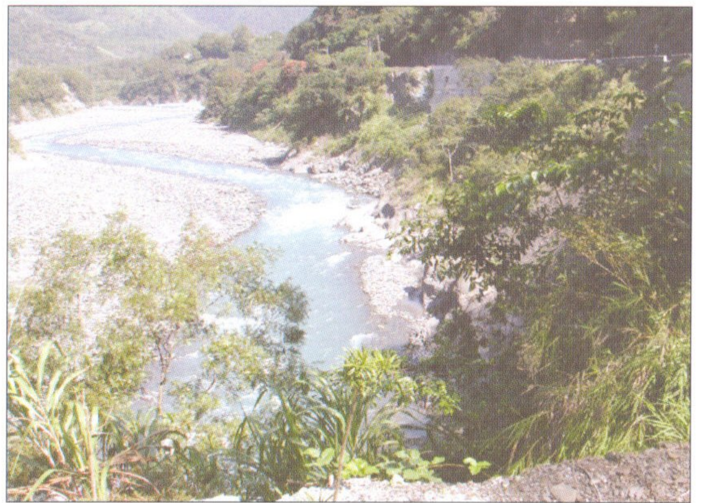
圖 3 高屏溪上游—老藺溪

等議題。本年度分階段在大鵬灣和高屏溪上、下游放流鰻魚(表 1)。大鵬灣是台灣具單一開口的重要瀉湖，據聞過去曾有不少種鰻在每年秋冬之際下海產卵，但目前已相當罕見，因此，決議改變以往在外海放流種鰻的方式，而規劃在大鵬灣放流大型鰻魚，並透過大鵬灣國家風景區管理處的協助管理，將可充分利用大鵬灣的優勢環境，建立成為鰻魚的「棲地保種」基地。至於高屏溪水量充足，河域寬廣(圖 3)，適合鰻魚棲息，於 9 月 29 日放流由淡水繁養殖研究中心提供之中型鰻魚(圖 4)。為利於追蹤及記錄放流鰻的洄游、食性、成長與成熟等相關資訊，放流鰻的體表，都以液態氮烙上標識(圖 5)或在肌肉植入晶片標識(圖 6)或鐵線微標識(圖 7)，以資辨識。