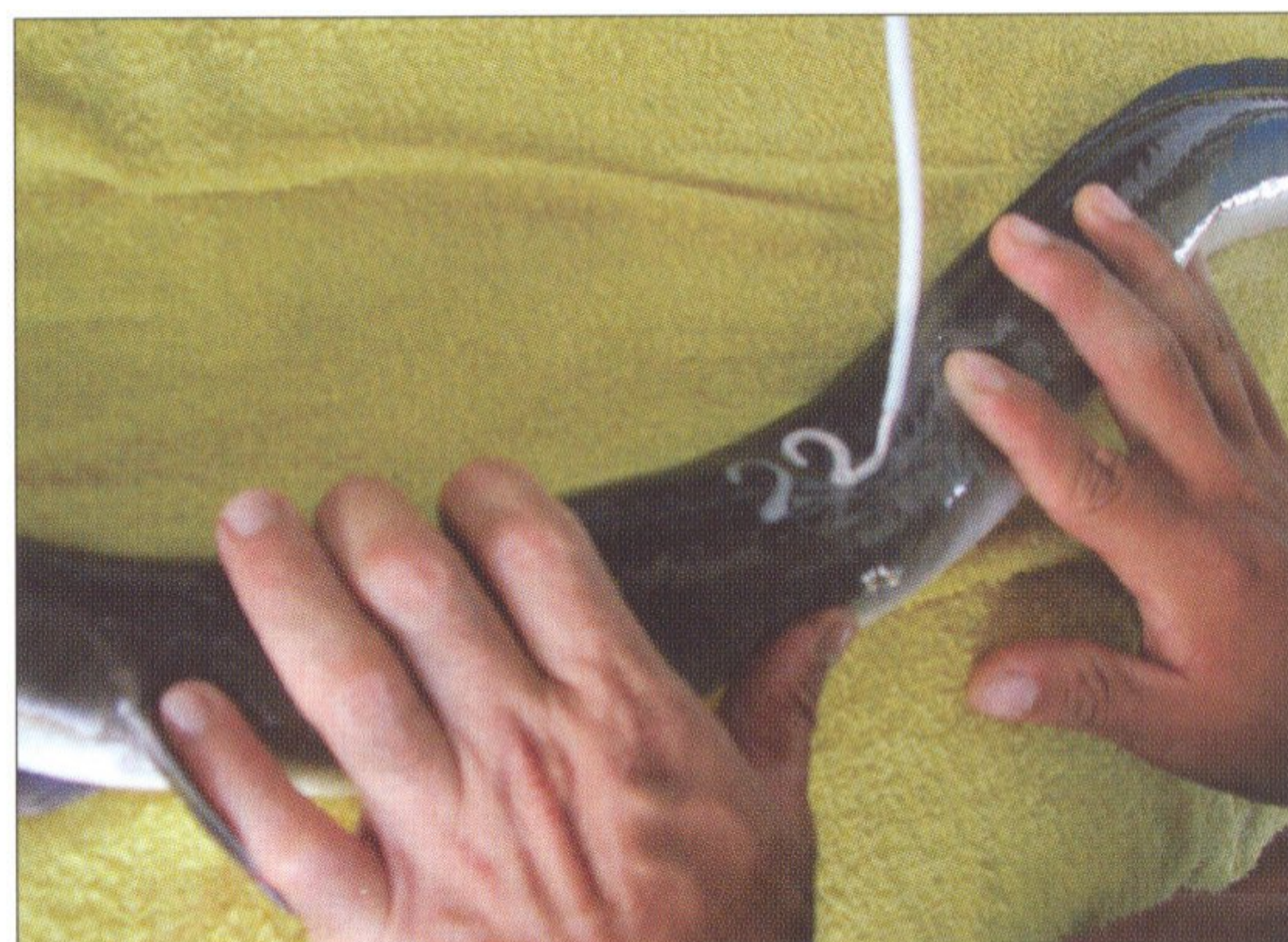
圖 5 液態氮標識