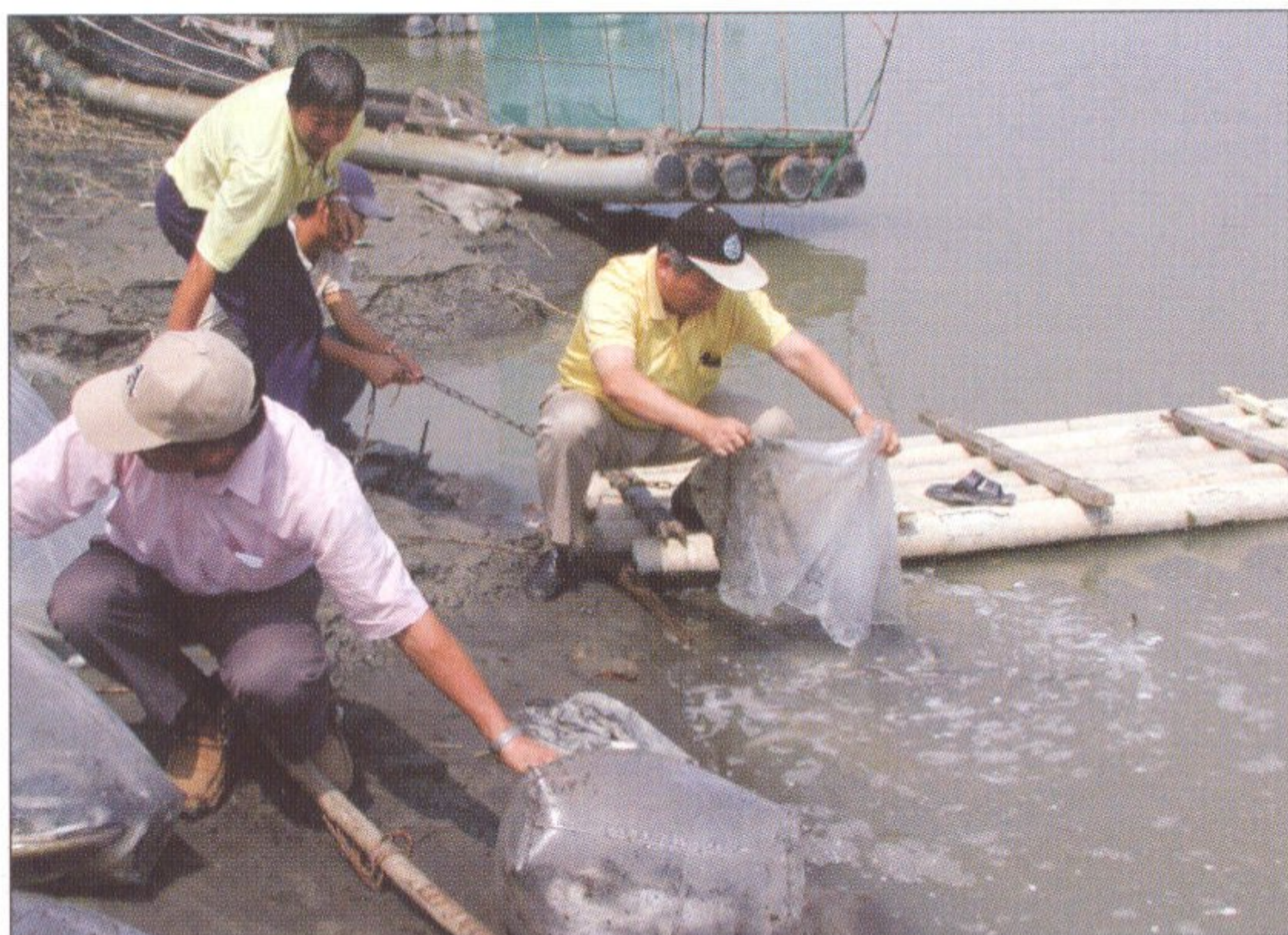
圖 4 在高屏溪放流中型鰻魚