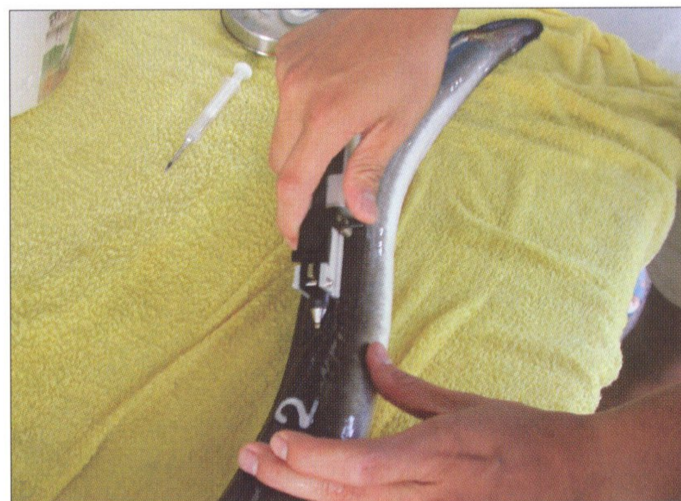
圖 7 鐵線微標識