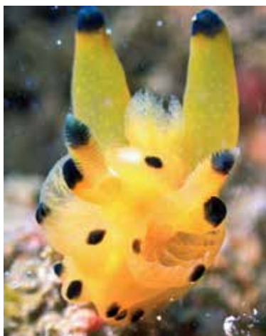
圖 2 雷丘海蛞蝓