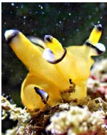
圖 1 皮卡丘海蛞蝓

海蛞蝓的大家族中，外型酷似皮卡丘的「太平洋角鞘海蛞蝓」( Thecacera pacifica ) (圖 1)，是潛水人最愛不釋手的超級巨星。每年夏天東北角潛季開跑，絡繹不絕的潛客在豔陽熱情的考驗下，背負重達數十公斤的潛水裝備，沿著東北角崎嶇的礁岩地形飛「岩」走壁，個個氣喘吁吁又揮汗如雨地抵達入水點，就是為了收服那可遇不可求的夢幻 Pokémon-皮卡丘海蛞蝓。而另一種同屬角鞘家族的海蛞蝓 ( Thecacera spp.) (圖 2)，同樣有著鮮黃色的柔軟身體與額外點綴的黑色小斑點，被潛水員暱稱為雷丘 (皮卡丘進化版)，其受歡迎程度與皮卡丘海蛞蝓不相上下；而這群角鞘家族的海蛞蝓是以苔蘚蟲 (圖 3) 為主食，因此不妨在苔蘚蟲豐富的礁石或沙地多做停留，耐心尋覓牠們的蹤影。