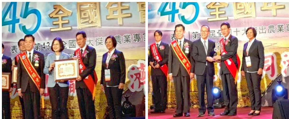
鄭金華研究員接受蔡總統及農委會陳副主委頒發獲選證書與獎章