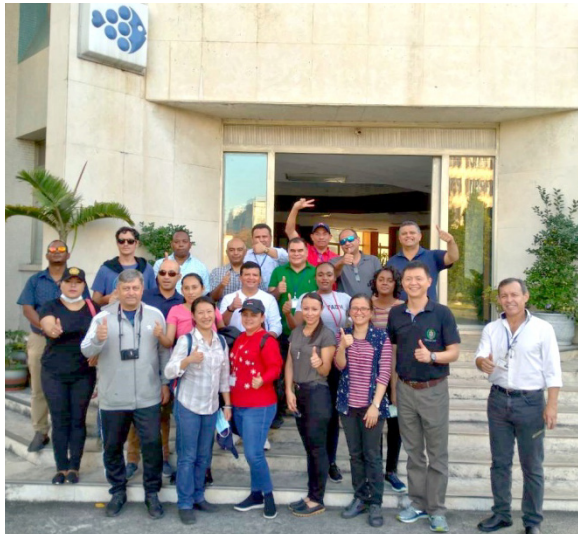
遠朋國建班第 166 期學員參訪團一行合影