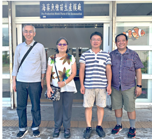
亞太糧肥中心貴賓一行合影